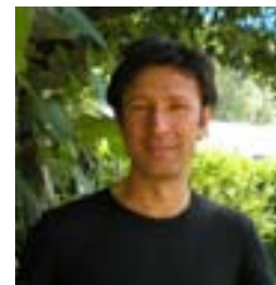
Lorenzo Pierobon www.musicoterapia.monza.net

Martin Brofman ci farà sperimentare come ogni chakra rappresenta una parte specifica della nostra coscienza e allo stesso tempo una parte specifica del nostro corpo. Ci aiuterà a vedere come i sintomi in una parte specifica del corpo rappresentano tensioni in una particolare parte della coscienza e come i sintomi iniziano quando accade qualcosa di particolare in un particolare momento della vita della persona. La comprensione della causa interna del sintomo ci permette non solo di guarire il sintomo ma anche di rilasciare la causa, ossia la tensione che creò il sintomo. Durante la sua presentazione saremo guidati attraverso l'esperienza del sentire e del vedere i chakras ed di impossessarci dei modi per capire ciò che vediamo. Per qualsiasi esperienza di sintomi che abbiamo sperimentata ci sarà data la chiave per capire ciò che ci è stato detto dal sintomo, ciò che è accaduto nella coscienza e ciò che bisogna fare.