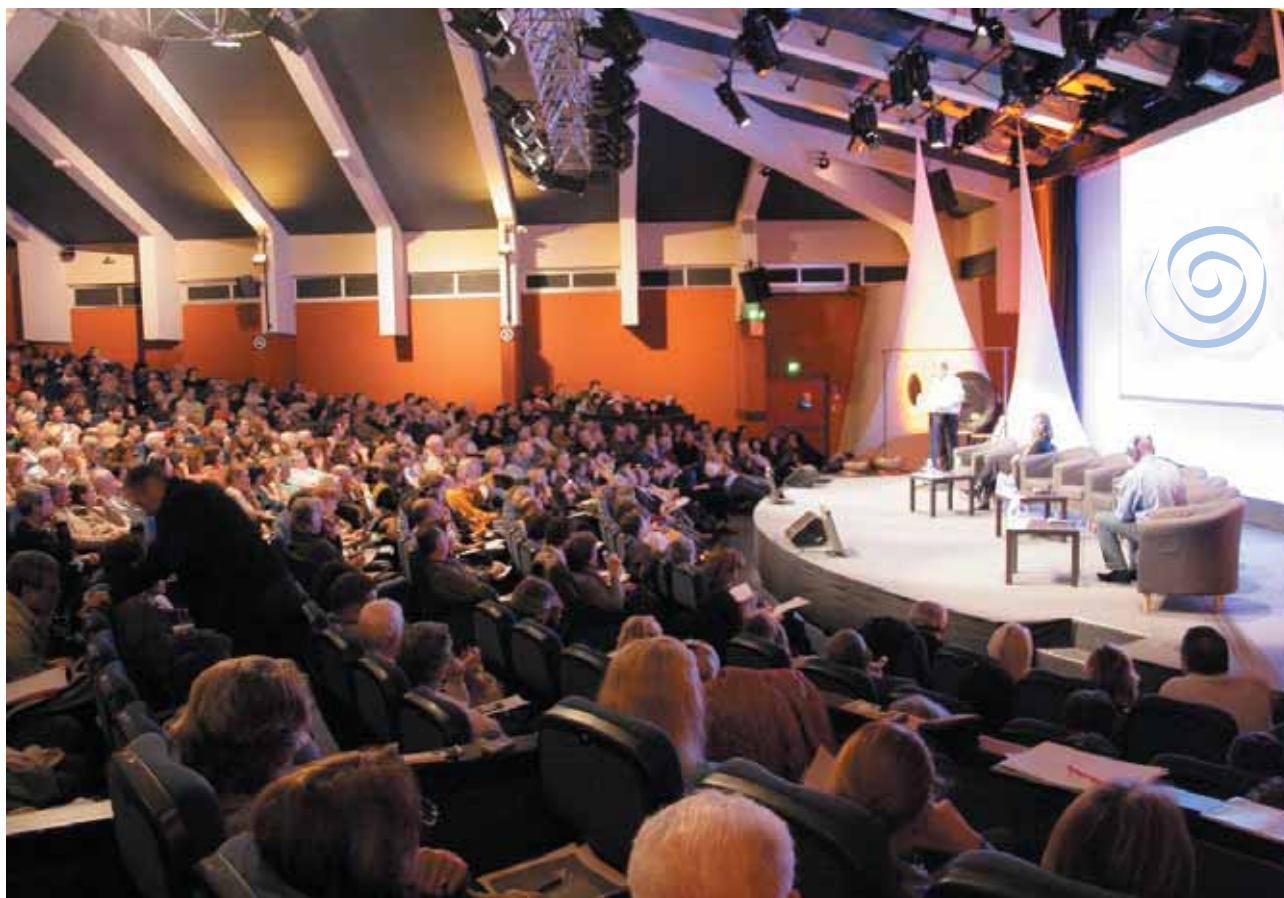
Congrès 2010 à Aix-en-Provence

La SCIENCE AFFECTIVE est le champ d'expérience clinique et biologique qui fait de la médecine générale et de l'homéopathie des MEDECINES DE L'INCONSCIENT. Avec le stress du Protéion, Bernard Vial développe les constatations objectives des profils protéiques informatisés du CEIA et aborde « l'entrée en matière » de l'information (PHYSIOLOGIE DE L'INFORMATION).